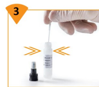
3 Appuyer l'écouvillon sur la paroi du flacon pour extraire le plus de liquide possible. Jeter l'écouvillon et refermer le flacon.