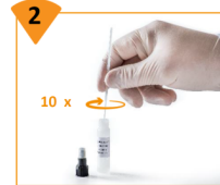
2 Décharger l'écouvillon au fond du flacon de diluant. Effectuer une dizaine de rotations de l'écouvillon contre les parois du flacon.