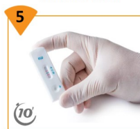
5 Lire le résultat à 10 minutes. Ne pas lire après 15 minutes.