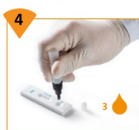
4 Déposer 3 gouttes dans le puits S de la cassette du test.